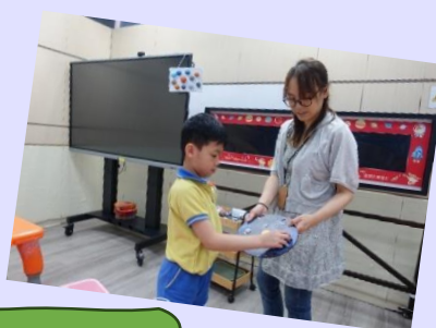
導師透過圖片，讓我們選擇想創作的星球及顏色，再一起創作不同星球。