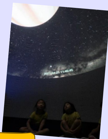
我們躺在天幕，一起認識太空上的不同星球。